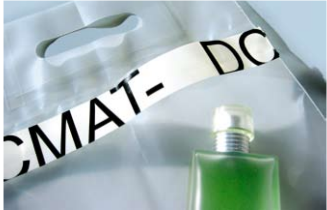
Eigens für den Flugverkehr konzipiert: qualiPOCKET® Sicherheitstragtasche von PetroplastVinora. Damit Flüssigkeiten problemlos transportiert werden können